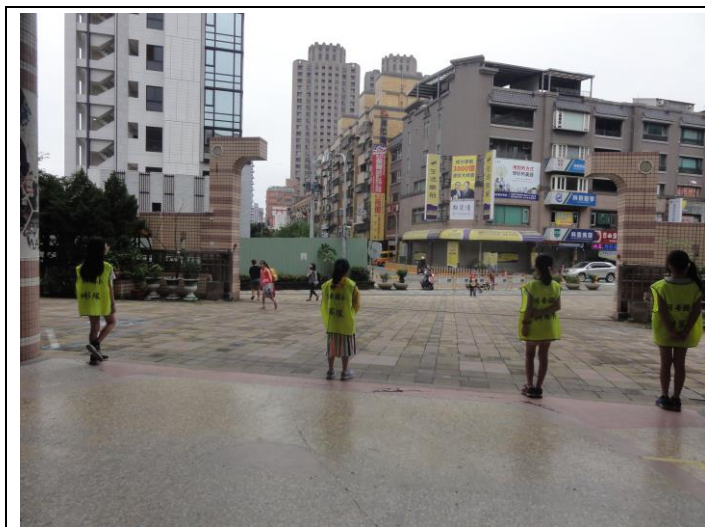
糾察隊維護學生上下學(一)