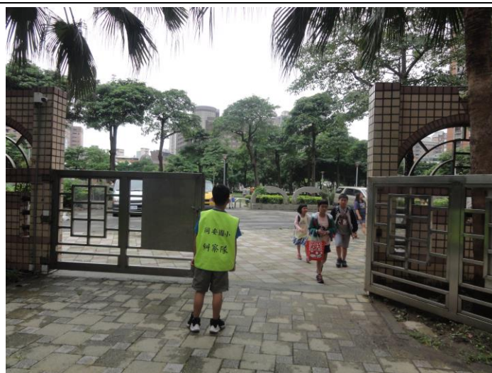
糾察隊維護學生上下學(四)