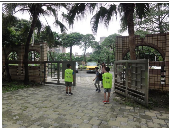
糾察隊維護學生上下學(二)