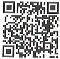
桃園市公立及非營利幼兒園 招生網