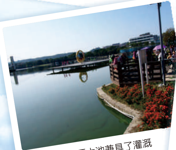
③ 龍潭區龍潭大池兼具了灌溉與休閒的多重功能。