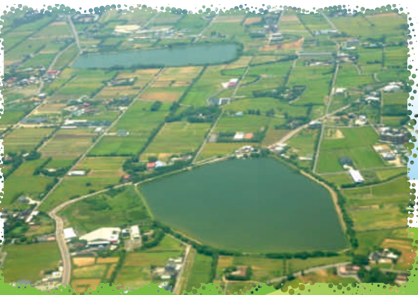
② 埤塘是早期 桃園 先民農業灌溉用水的主要來源之一。