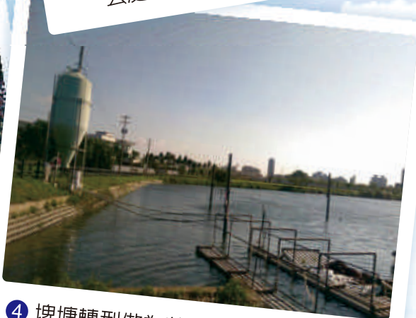
④ 埤塘轉型做為養殖池，居民用之從事淡水水產養殖業。