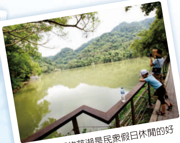
② 大溪區的慈湖是民衆假日休閒的好去處。