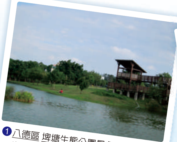
① 八德區 埤塘生態公園景色優美，也是環境教育的好場所。

蛻變後的埤塘可作爲養魚或家禽、家畜的養殖池；部分更轉型爲休閒觀光用途，如 龍潭大池 及 慈湖 。最值得一提的是，埤塘規劃爲生態景觀池後，不僅景色優美，更吸引各種生物棲息，成爲環境教育的最佳場所。