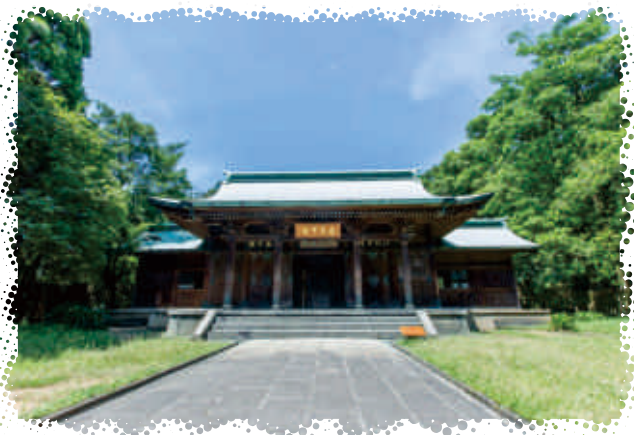
4 桃園市忠烈祠的前身為桃園神社，是目前日本境外唯一完整保留的神社建築。