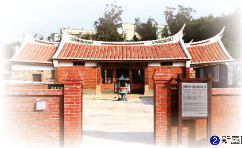
2 新屋區的新屋范姜祖堂又稱范姜祖厝，為本市客家建築的代表。