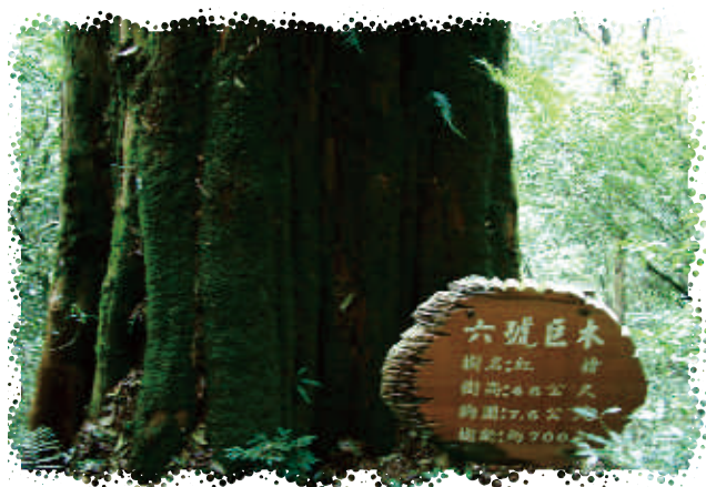
1 復興區拉拉山神木參天，保留了豐富的自然資源。

復興區 的地形以山地為主，有著得天獨厚的天然景觀，沿線盡是山巒翠綠的好風光。本區居民以 泰雅族 為主，其歌舞與民俗活動蘊藏著濃厚的人文氣息，是 桃園市 最富魅力的觀光勝地。