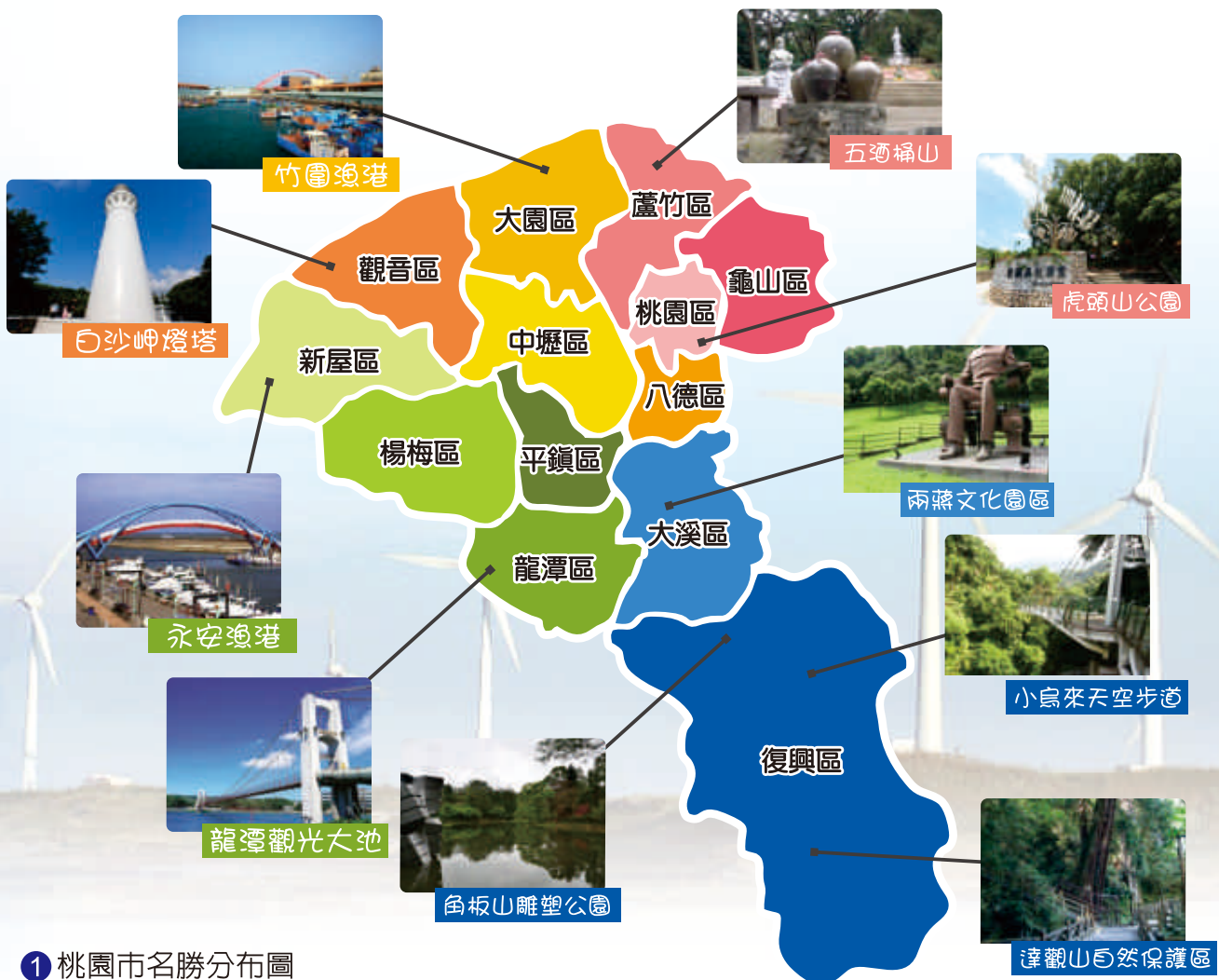
1 桃園市名勝分布圖

除此之外，桃園也規劃了 兩蔣文化園區 ，園區除了 慈湖 與 後慈湖 的自然風光外，也包括 慈湖陵寢 、 慈湖紀念雕塑公園 ，結合了歷史、人文、自然生態的特色，吸引不少民眾前往參觀及遊覽。