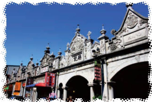
3 和平老街因大漢溪船運而發展成商業市街，牌樓上繁複的雕刻讓遊客讓流連忘返。